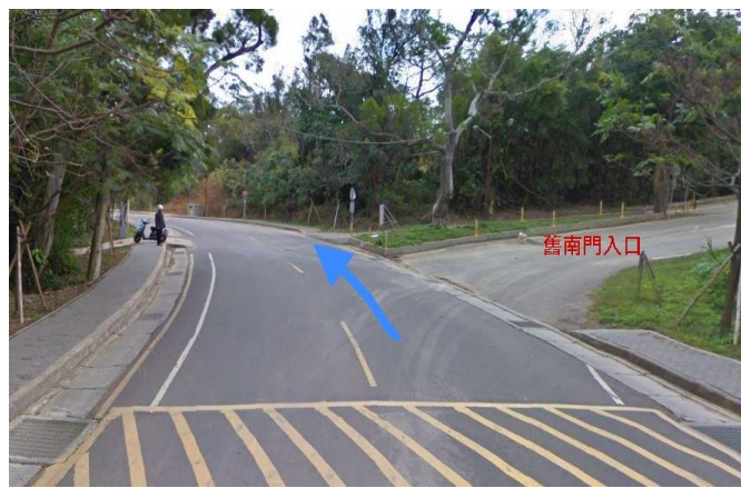
2. 育成創新大樓→ 舊南門入口