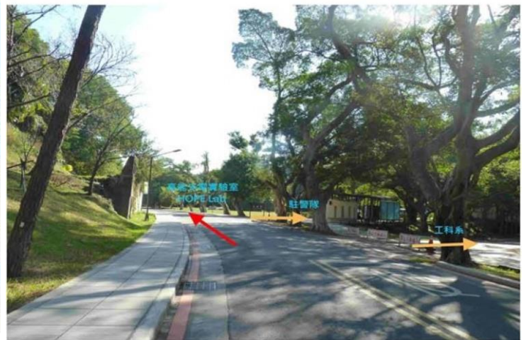
4 野台(小吃部旁)→駐警隊