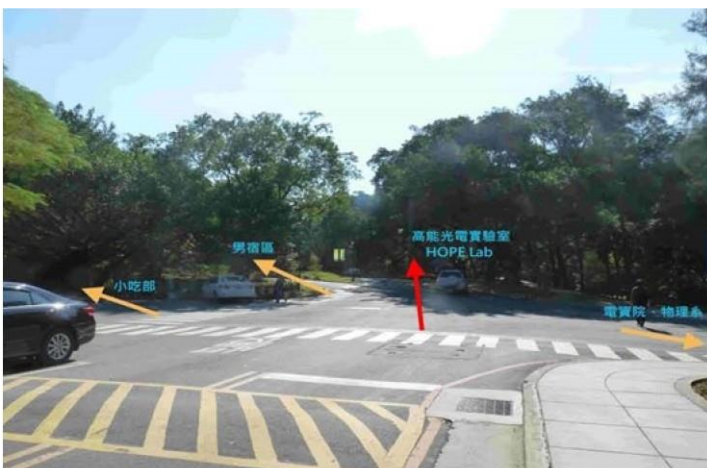
3 圖書館→野台(小吃部旁)