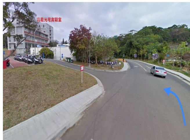
4.南校區廢水處理廠 →左轉 奕園停車場