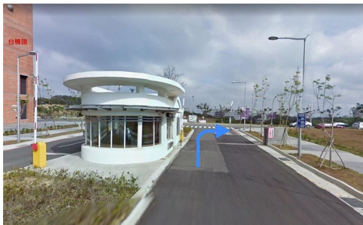
1.南門口→右轉 育成創新大樓