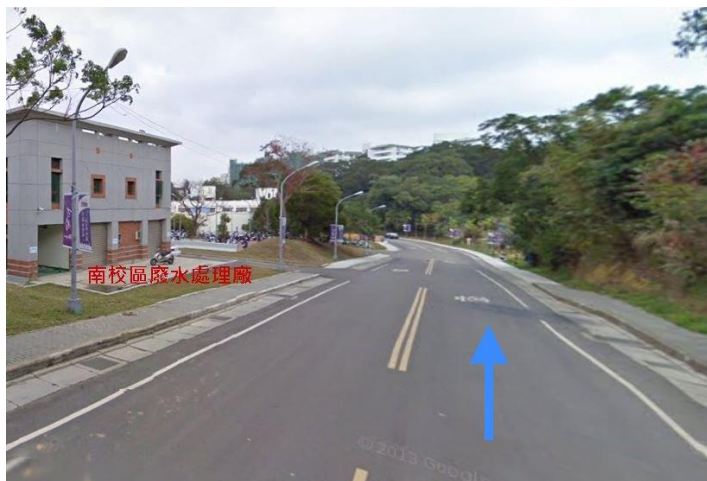
3. 舊南門入口→南校區廢水處理廠