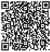
Sony Taiwan CSR 官網