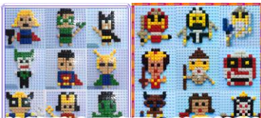
(創意積木示意圖，隨機給款)