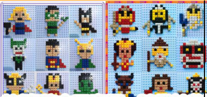
(創意積木示意圖，隨機給款)