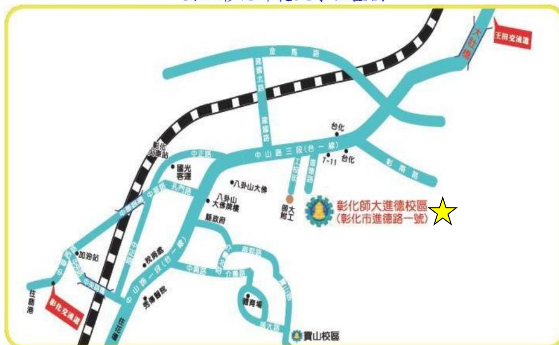
國立彰化師範大學位置圖