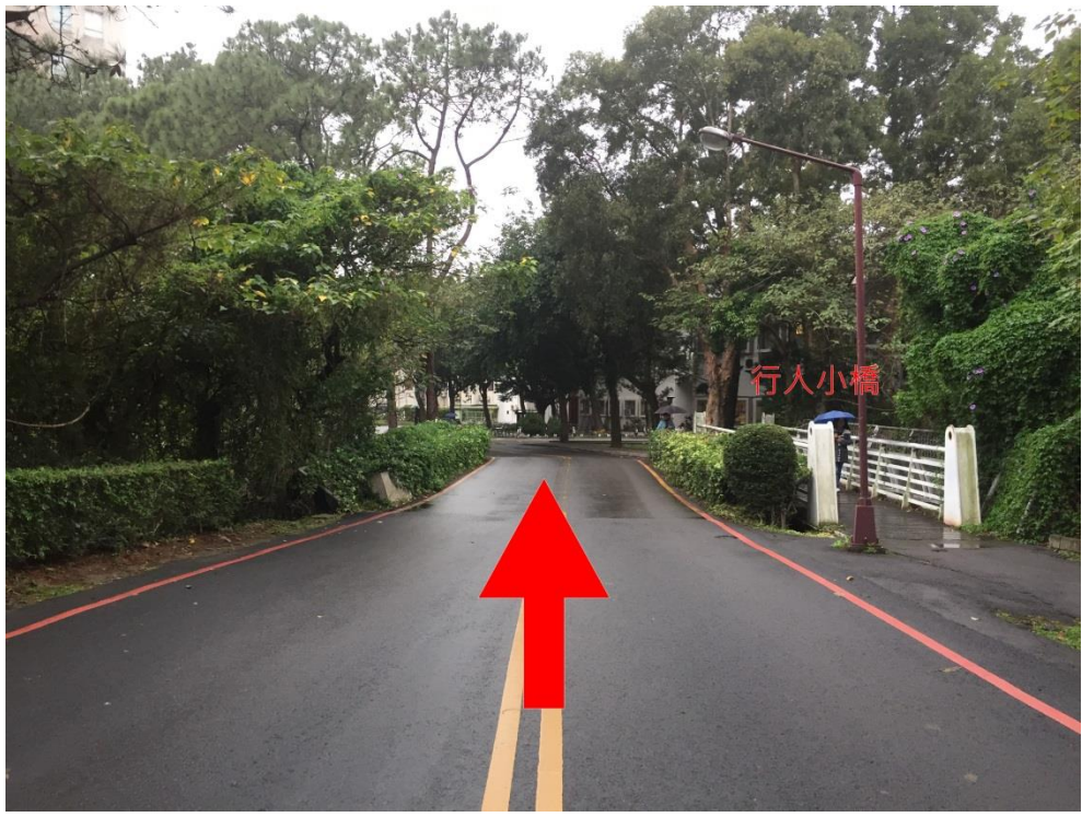
經過十字路口，左手邊大樓即為台達館。