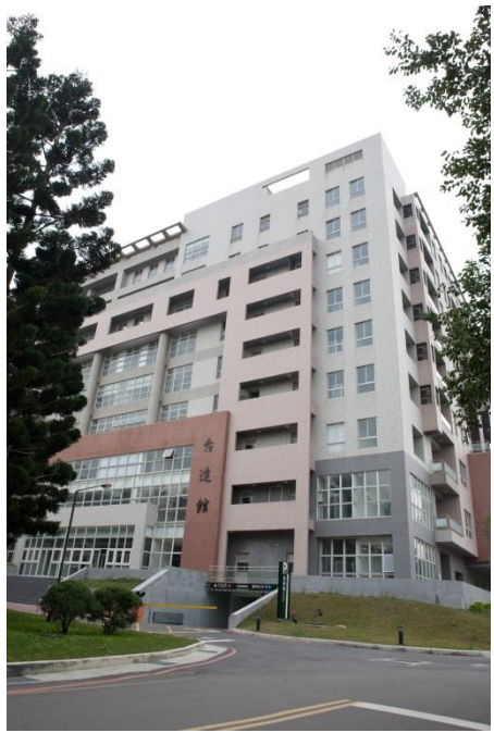
路邊停車格，皆可停放，當日會開放台達館地下停車場。