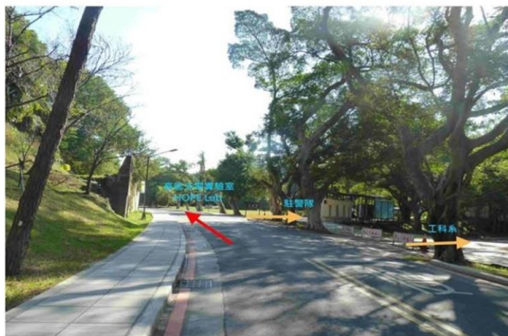
4 野台(小吃部旁)→駐警隊