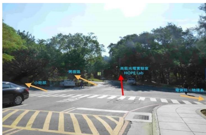
3 圖書館→野台(小吃部旁)